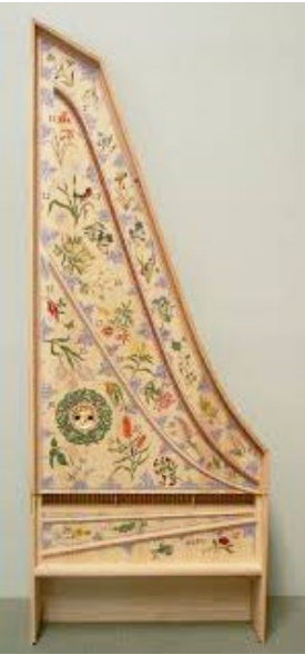
Claviciterium frühes 18.Jhdt