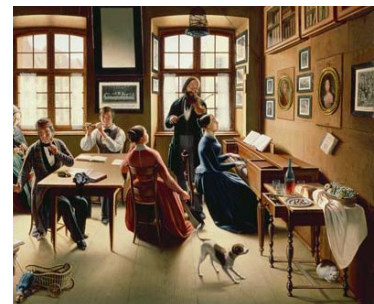
Basler Hausmusik mit Tafelklavier in der Biedermeier-Zeit