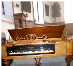
Tafelklavier 1861, Dorfkirche Riehen